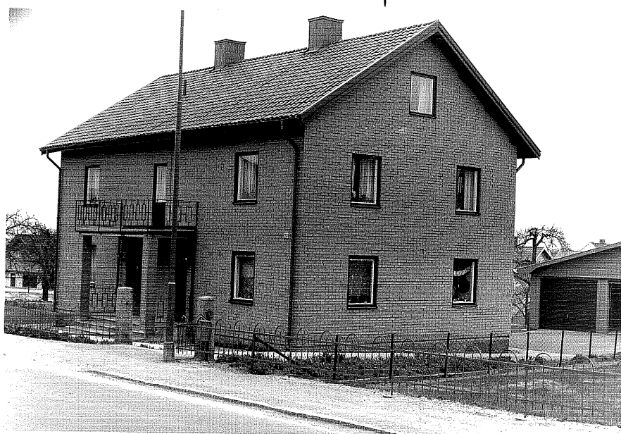
Bostadshus a fr,SO,4:10.

Ödeshög sn Tulpanen 3 Storgatan 30 foto:M.Wikdahl,1978.