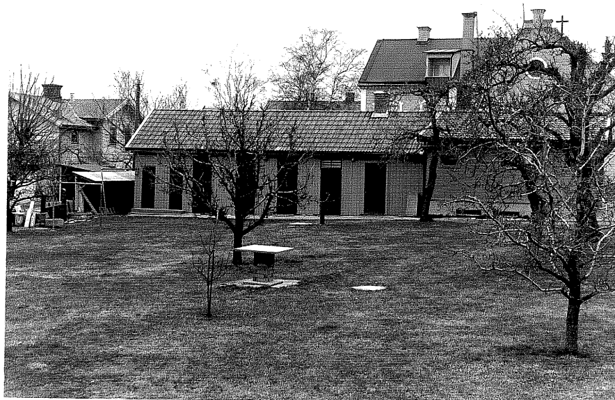
Uthus b fr.V,4:11.