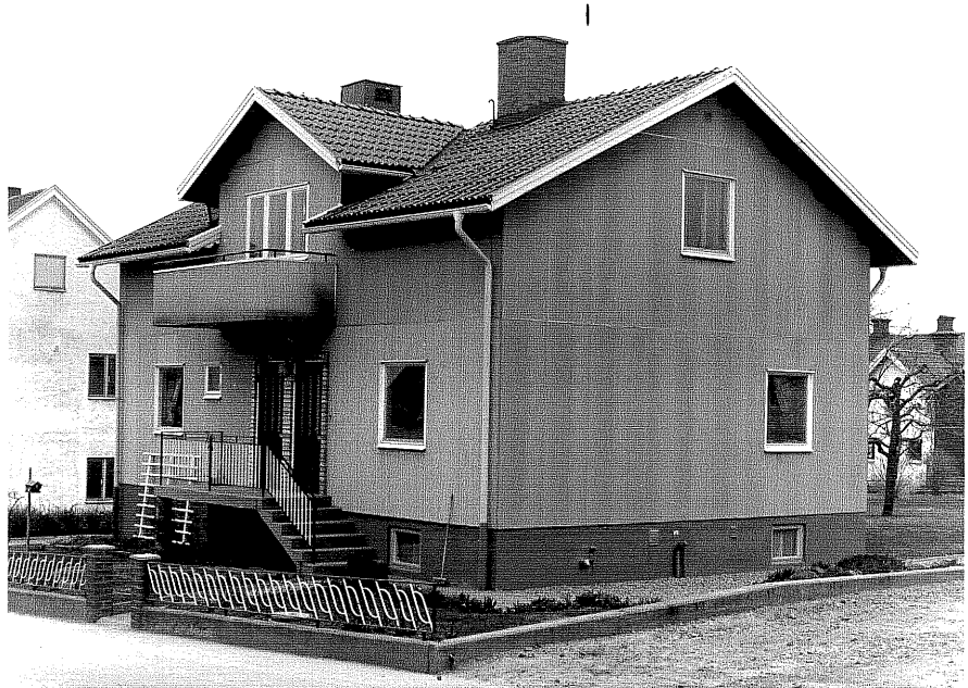
Bostadshus a fr.SV,4:8

Ödeshög sn Tulpanen 5 Stråtomtagatan 5 foto:M.Wikdahl,1978.