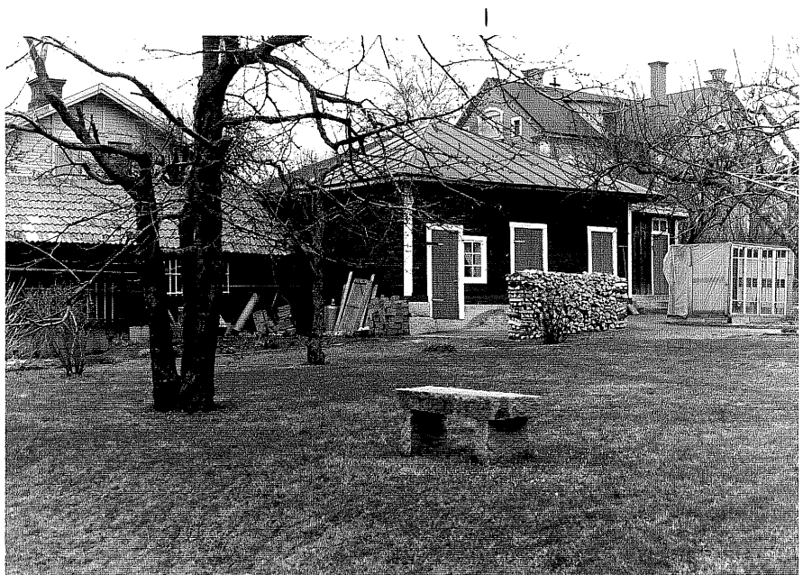
Uthus b fr.NV,4:7