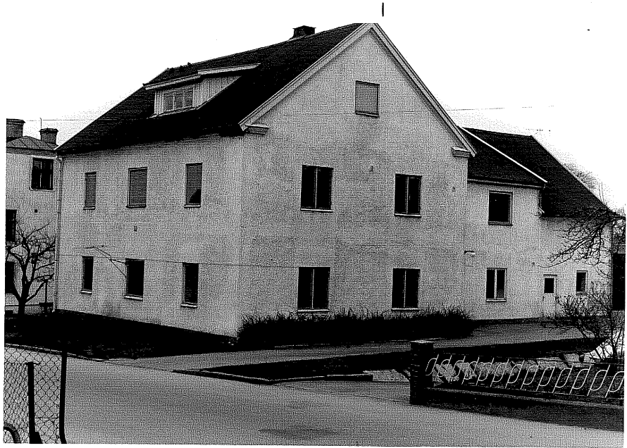
Bostadshus a fr.SV,4:6.

Ödeshög sn Tulpanen 6 Stråtomtagatan 3 foto:M.Wikdahl,1978.