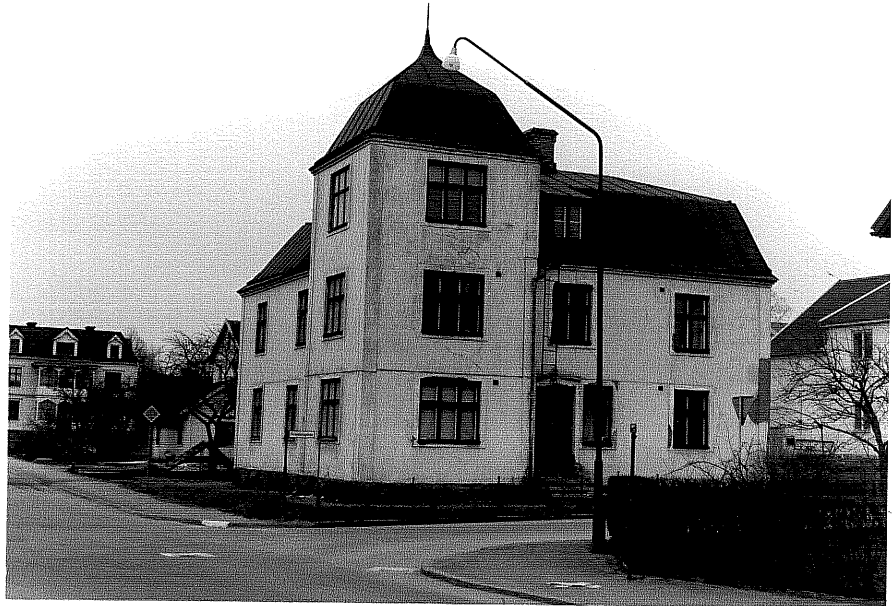
Bostadshus a fr.NV,4:4.

Ödeshög sn Tulpanen 7 Stråtomtagatan 1 foto:M.Wikdahl, 1978.