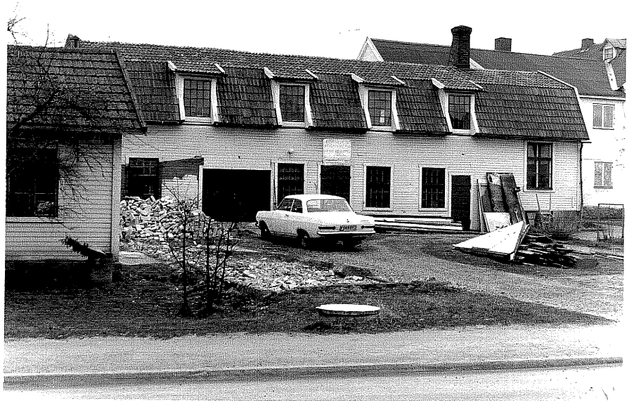
Uthus c fr.N,4:5.