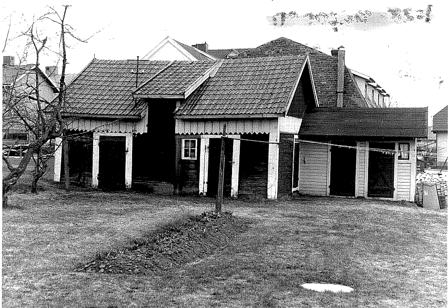
Uthus c och d fr.O, 4:22.