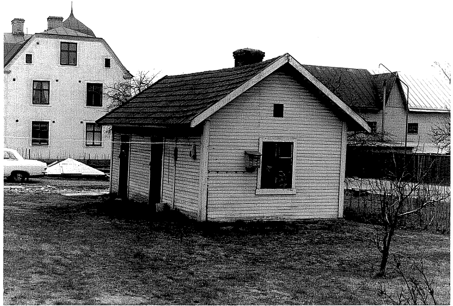
Uthus b fr.0, 4:23.

Ödeshög sn Tulpamen 8 Järnvägsgatan 1 foto:M.Wikdahl,1978.