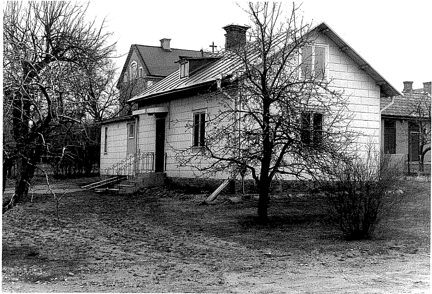
Bostadshus a fr.V,4:9.

Ödeshög sn Tulpanen 9 Stråtomtagatan 7 foto:M.Wikdahl,1978.