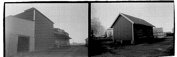
Spannmålsmagasin 30. Godsmagasin 31. Fäl 10 Fäl 11 SV