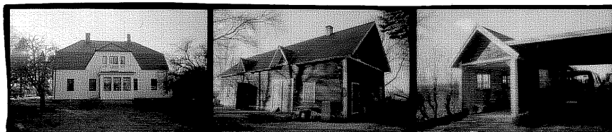
Bostadshus från SV 20 Ladugård från NV 21 Garage från SO 22

(1) Utbyggd glasad veranda i norr med ingång. Frontespis.