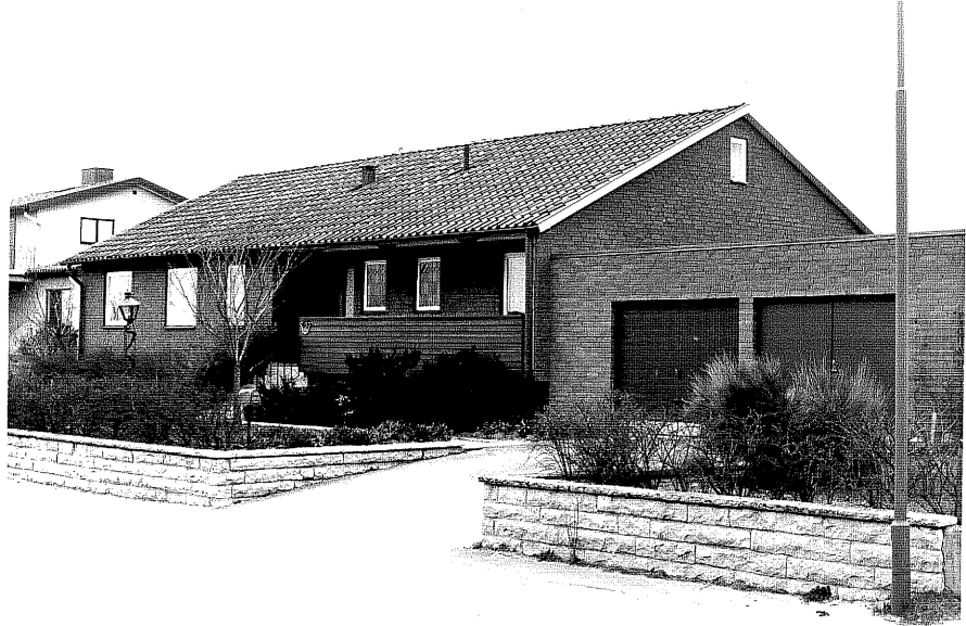
Bostadshus fr.V, 8:34.

Ödeshög sn Utkiken 17 Odalvägen 2 foto:M.Wikdahl,1978.