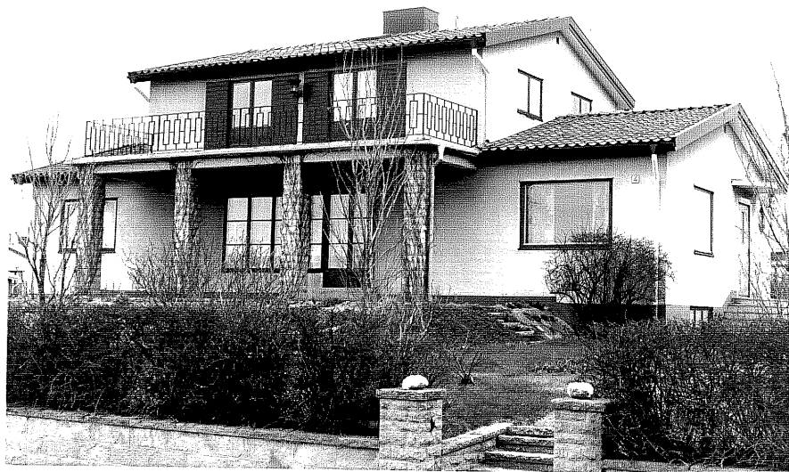
Bostadshus fr.NV, 8:33.