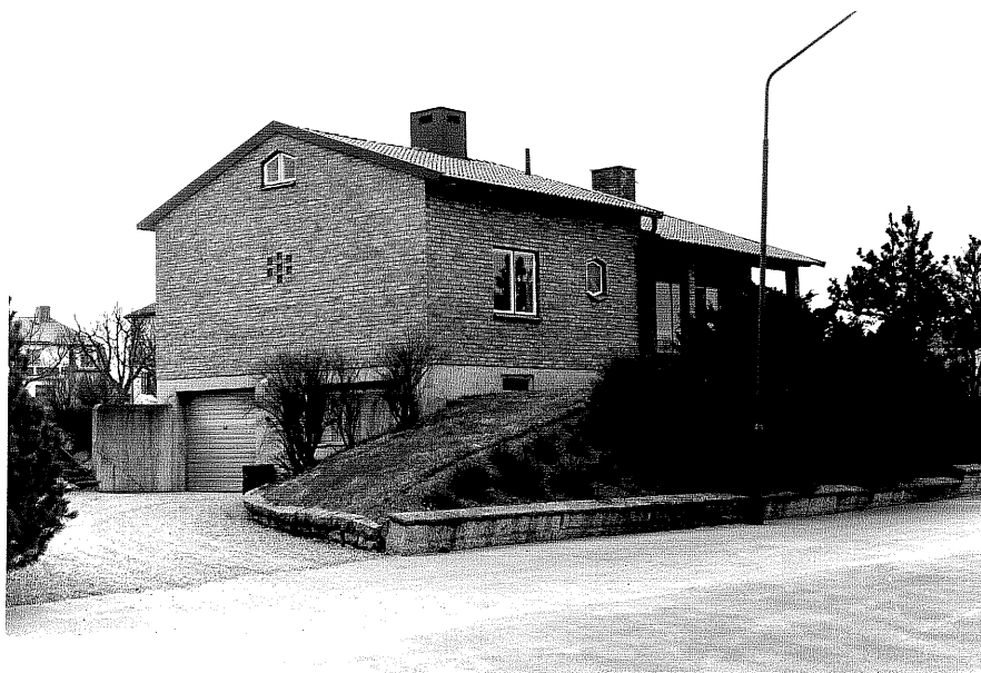
Bostadshus fr.N, 8:32.

Ödeshög sn Utkiken 3 Odalvägen foto:M.Wikdahl,1978.