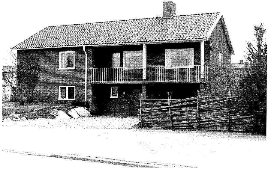
Bostadshus fr. N, 8:31.

Ödeshög sn Utkiken 4 Kungsvägen 9 foto: M. Wikdahl, 1978.