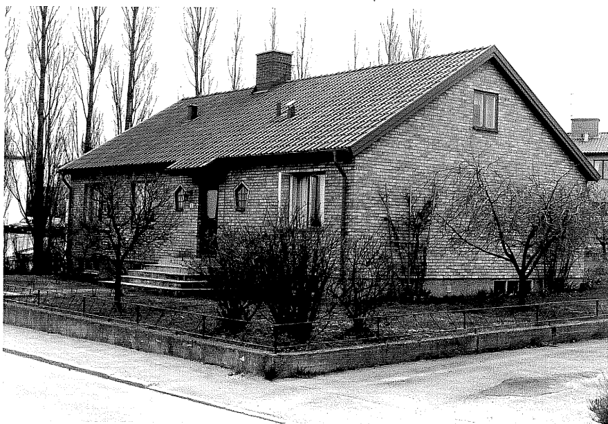
Bostadshus fr.NV, 8:29.

Ödeshög sn Utkiken 6 Kungsvägen 5 foto:M.Wikdahl,1978.