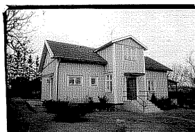
Mangårdsb. NO 37