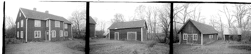
Mangårdst. NO 32. Bod från NO 33. Uthus, brygghus från Ö 34.