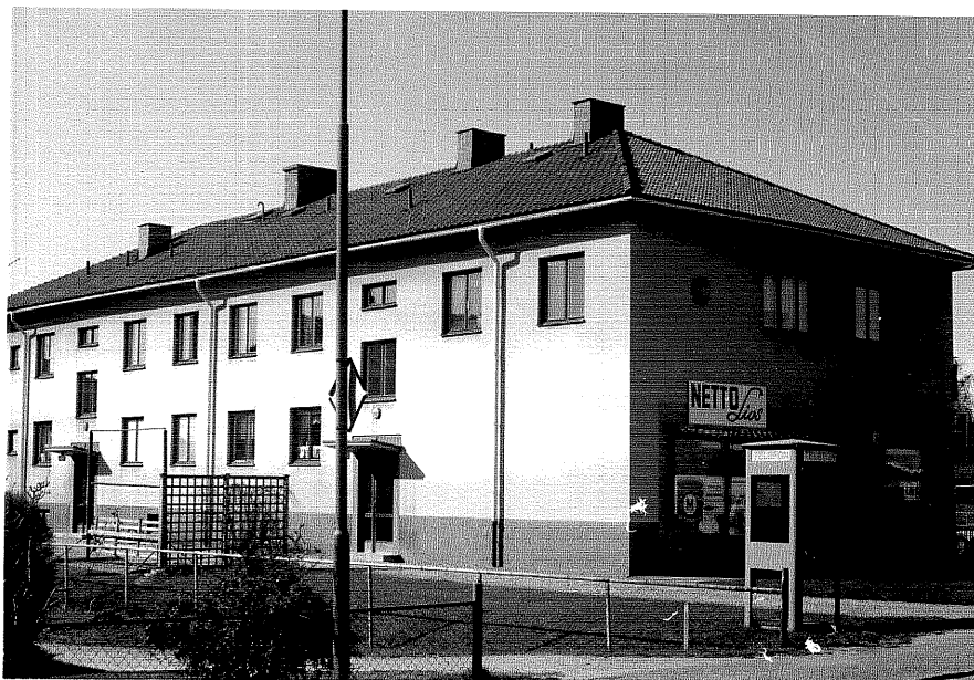
Hyreshus fr.NO, 12:20.