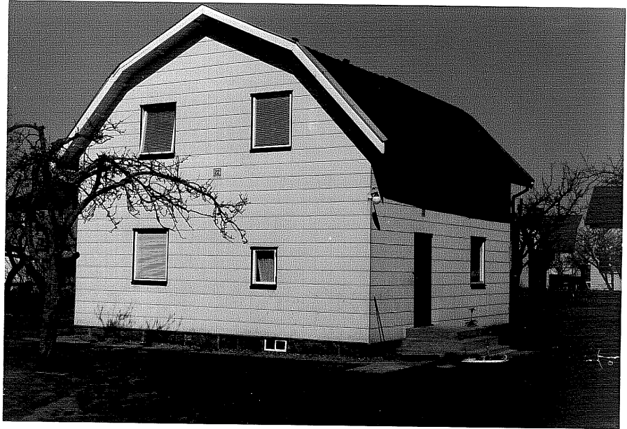
Bostadshus a fr.50, 12:32.

Ödeshög sn Vinkeln 10 Södra vägen 22.