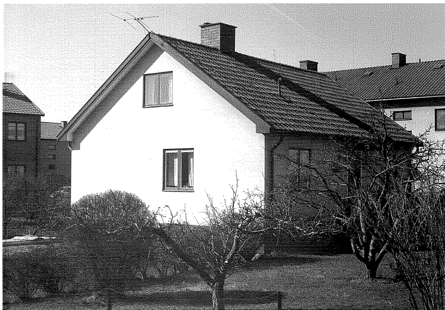
Bostadshus fr.NV, 12:21.

Ödeshög sn Vinkeln 2 Mjölbyvägen 24. foto:M.Wikdahl,1978.