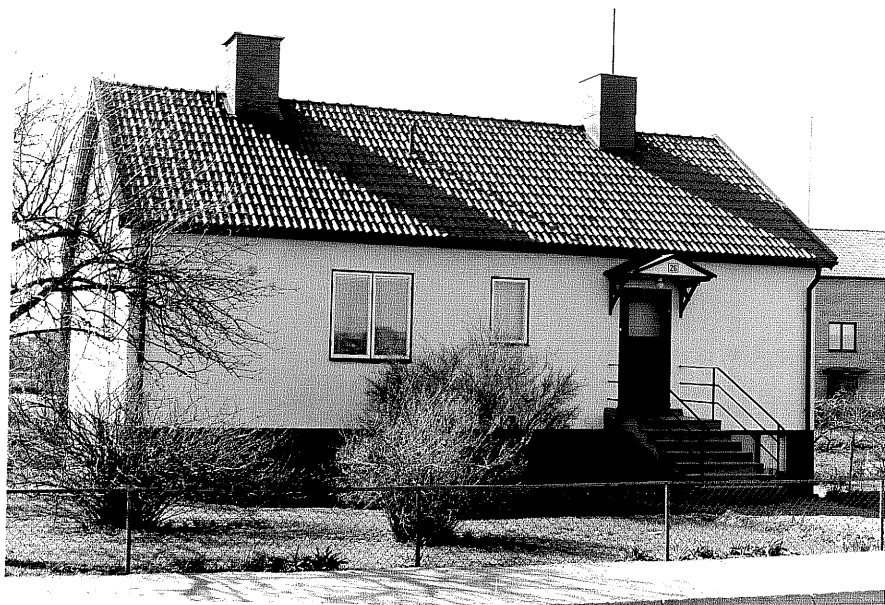
Bostadshus fr.N, 12:22.

Ödeshög sn Vinkel 3 Mjölbyvägen 26 1978.