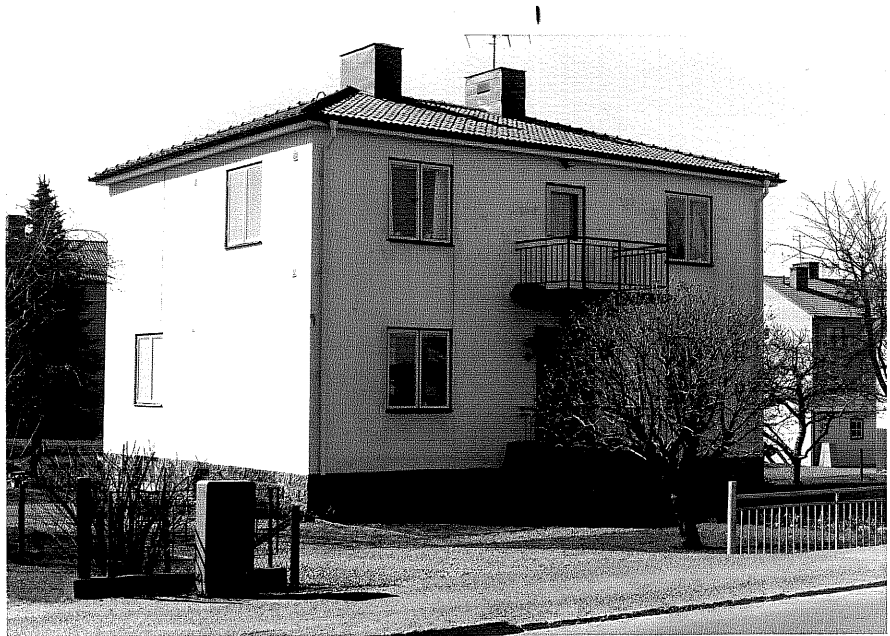
Bostadshus fr.NO, 12:23.

Ödeshög sn Vinkeln 4 Mjölbyvägen 28. foto:M.Wikdahl,1978.