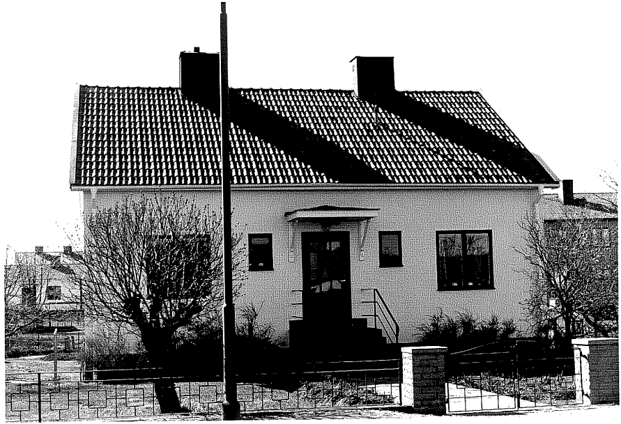
Bostadshus fr.N, 12:25.

Ödeshög sn Vinkel n 5 Mjölbyvägen 30 foto:M.Wikdahl,1978.