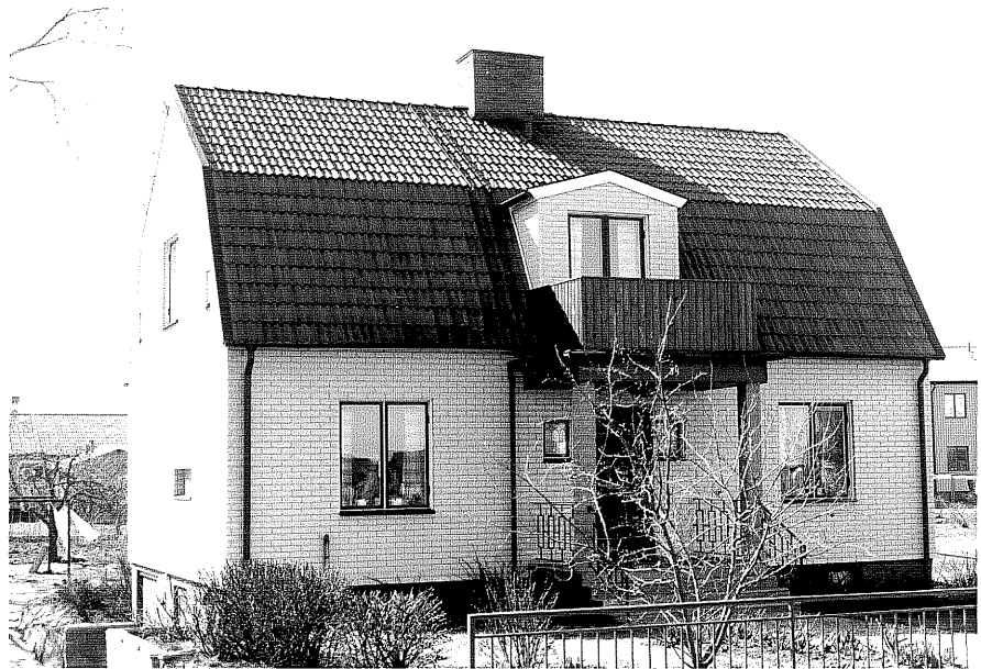
Bostadshus fr.N, 12:27.

Ödeshög sn Vinkeln 7 Mjölbyvägen 34 foto:M.Wikdahl,1978