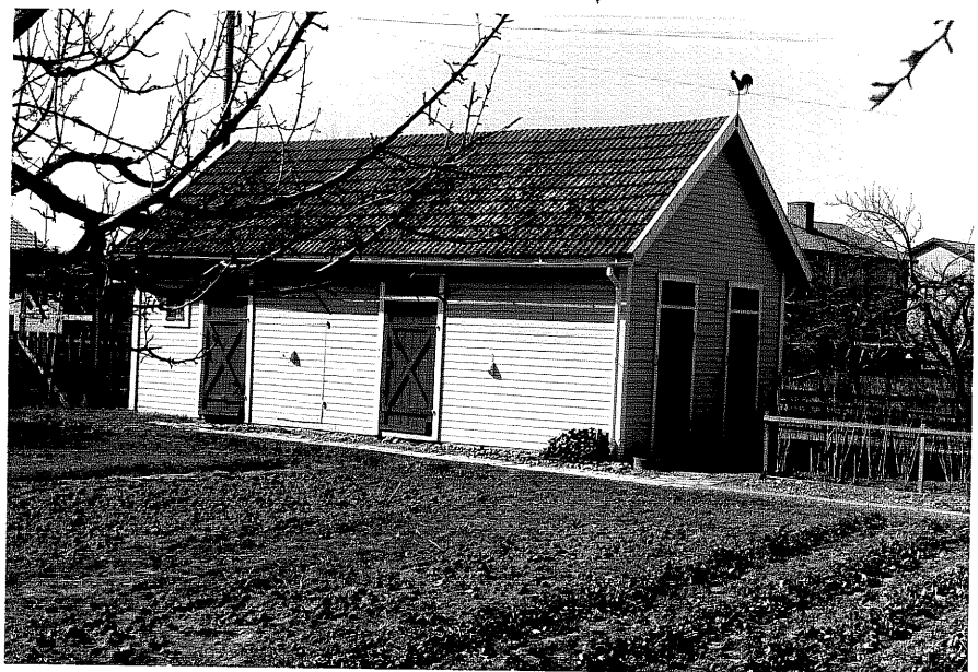
Uthus b fr.NO, 12:29.