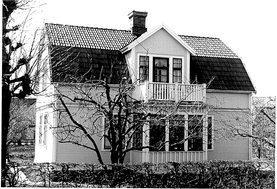
Bostadshus a fr.N, 12:28.

Ödeshög sn Vinkel n 8 Mjölbyvägen 361978.