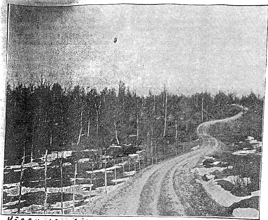
Vägen som ligger om Klintoner väg genom Pöttånge

Kom törstige till källan fram, Drick i djupa, fulla drag. Skåda Herrens härlighet Och sjung hans pris i evighet.