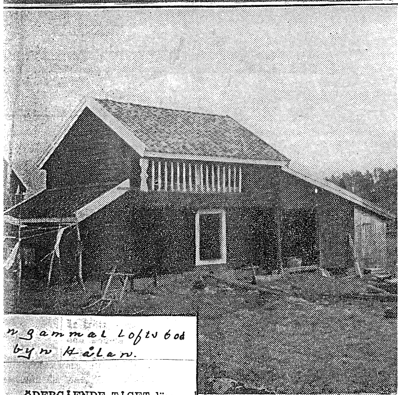
En gammal Loftsbod byn Hälsjö.

ÖDERGÅENDE TÅGET lämnade av mig vid Sommens järnvägsstation en aprilidagsmorgon. Innan jag steg upp i en väntande bil, hann jag se, att ännu hade ett gråaktigt istäck som gav sjön detta livlösa utseende, är vanligt i vårtider. Så bar det vidare, inåt Holavedens skogsvid-