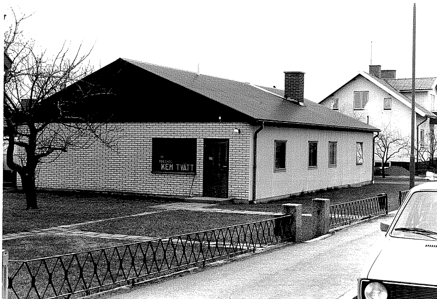
Tvättereri b fr.N, 5:27.