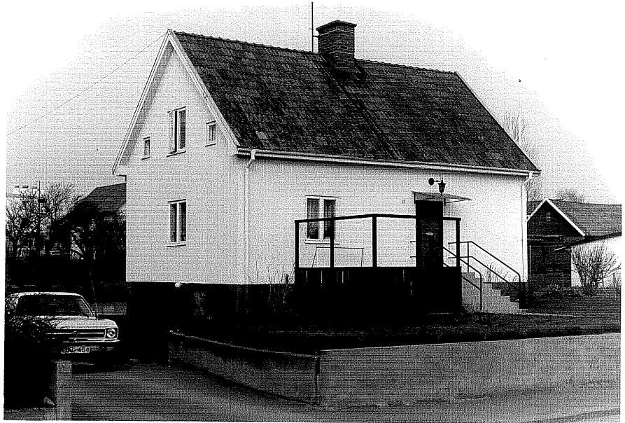
Bostadshus fr.SV, 6:6.