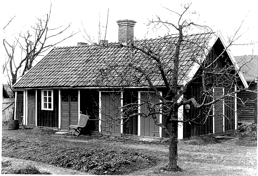
Uthus b fr. 0, 5:29.