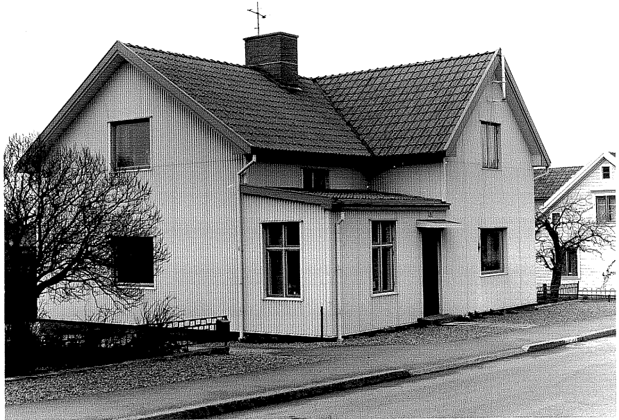
Bostadshus a fr.O, 5:32.

Ödeshög sn Väktaren 3 Smedjegatan 16 foto:M.Wikdahl,1978.