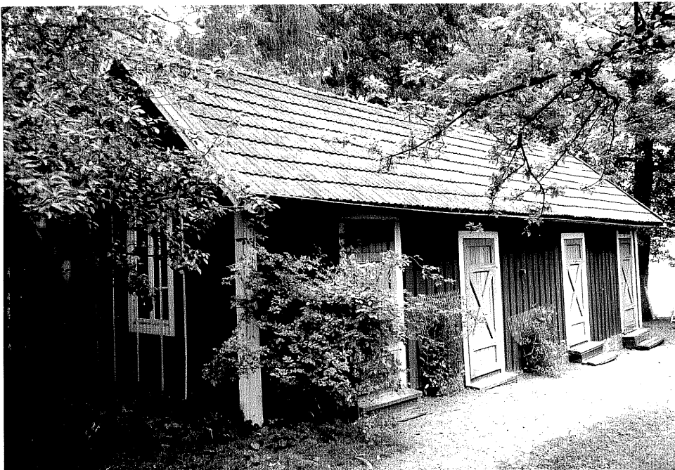
Neg. nr. V.T 04:34 Uthus mot sydost