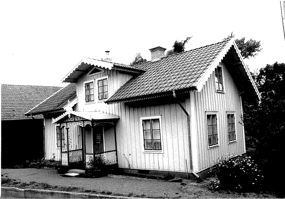
Neg. nr. V.T 04:33 Bostadshuset mot sydost

Ödeshögs kommun V:a Tollstad socken Västergården 2 9 Västergårdsvägen 4