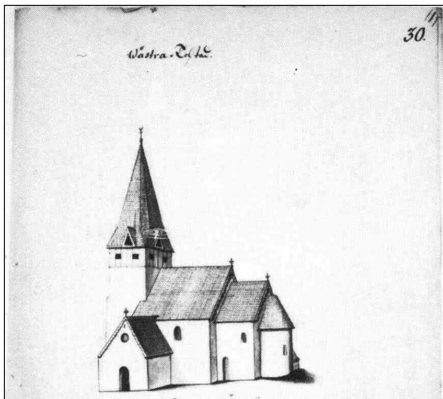
Avbildning av kyrkan på 1670-talet av Elias Brenner.

klosterruin, vilket avlogs. Det beslöts då att den nya kyrkan skulle byggas på den gamla kyrkplatsen. Prästgården som var belägen i direkt anslutning till kyrkans västra parti tillät ingen förstoring av långhuset. Församlingen önskade dock behålla den nedre delen av det medeltida tornet som sakristia. Det innebar att den nya kyrkan förlades i nord-sydlig riktning väster om tornet. Majoriteten av landets kyrkor är orienterade i öst-västlig riktning. I Östergötland är det få kyrkor som har en annorlunda placering.