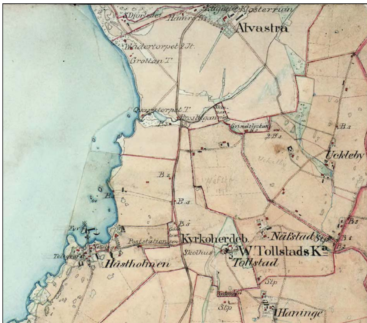
Utsnitt ur Häradsekonomisk karta 1868-77.

Huvudnäringen har varit jordbruk, med bisysslor som bl a fiske och torvtäckt. Inom Västra Tollstad socken finns även ruinerna efter Alvastra medeltida cistercienserkloster. Socknen har även i äldre tid innehaft tingsplats, vilken var belägen i Hästholmen, som var en medeltida stadsbildning. Vid Hästholmen har i senare tid bildats en tätort med hamn och järnväg. Detta har i sin tur givit förutsättningar för en etablering av mindre industrier. Inom socknen har det funnits två järnvägslinjer. Mellersta Östergötlands järnväg med sträckning Ödeshög – Vadstena öppnade för trafik 1888 och järnvägen mellan Mjölby och Hästholmen invigdes 1910. Båda banorna är numer nedlagda. Den äldre landsvägen från Stockholm och söderut har passerat genom socknen och förbi kyrkan. Omberg och trakterna vid Vättern med sina många historiska sevärdheter och den natursköna omgivningen har länge haft dragningskraft på författare, konstnärer och turister. Vid Vätterns strand byggde författaren Ellen Key sitt hem, som fick namnet Strand.