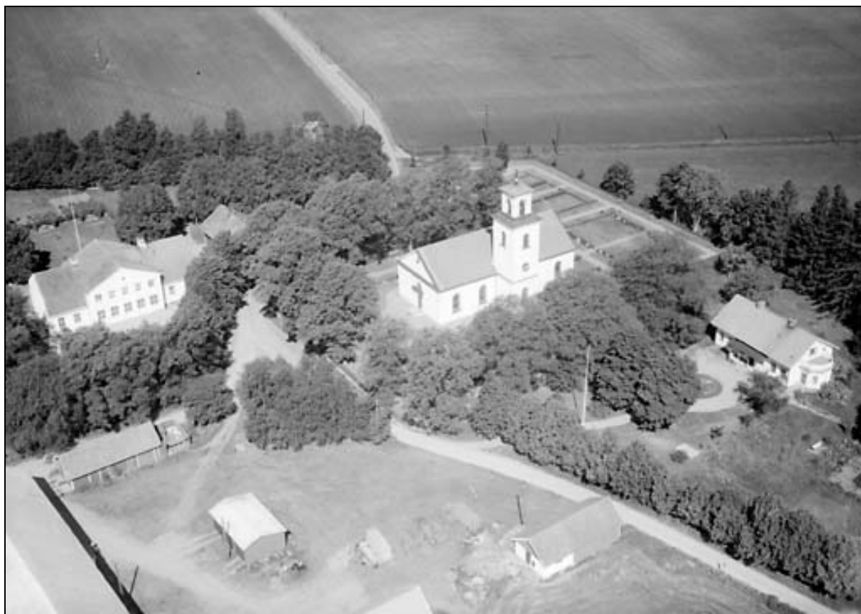
Flygbild över kyrkan och prästgården 1959.