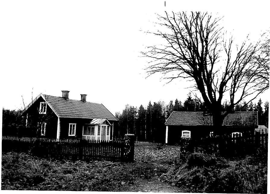
Neg. nr. T 07:08 Gårdsmiljö från NO

Ödeshögs kommun Trehörna socken Bråmålen 1:1 Bråmålen