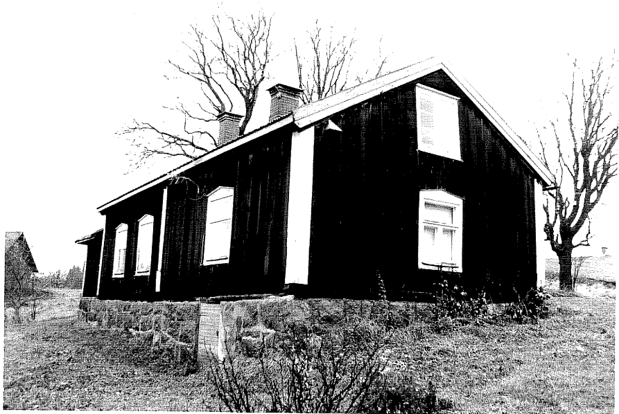
Neg. nr. T 07:09 Manbyggnaden från S