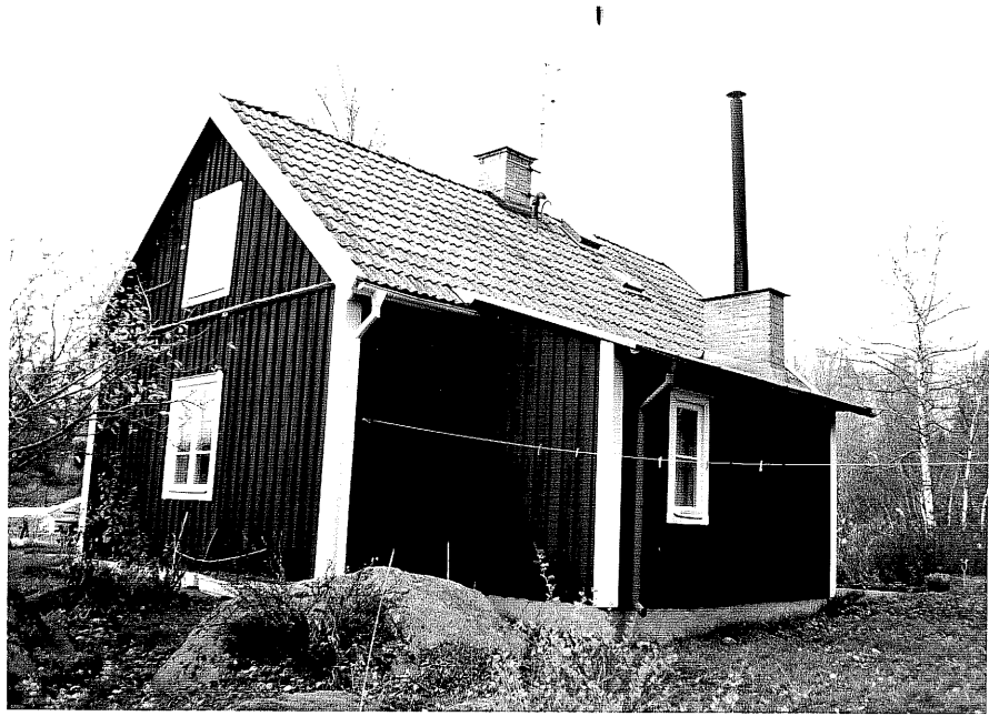
Neg. nr. T 02:27 Bostadshuset från S0