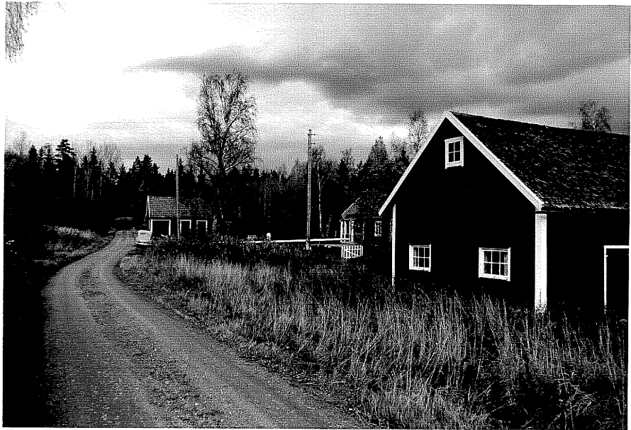
Neg. nr. T 02:31 Vättersborg i miljön från S

Ödeshög kommun Trehörna socken Vättersborg 1:2 Vättersborg