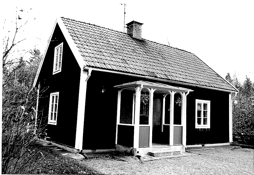
Neg. nr. T 02:26 Bostadshuset från NV