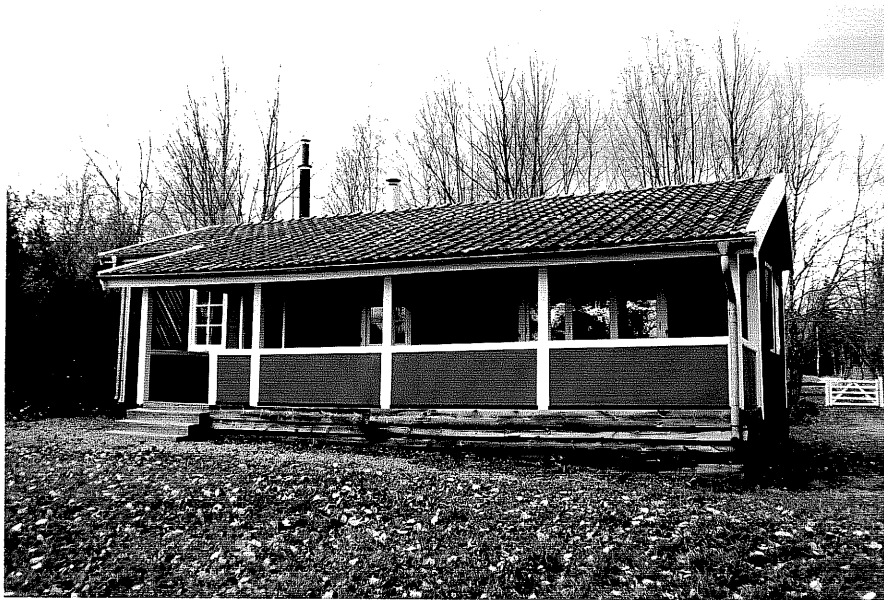
Neg. nr. T 02:23 Sommarstuga från S