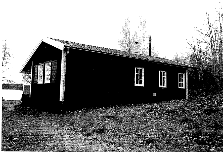
Neg. nr. T 02:25 Sommarstuga från NO