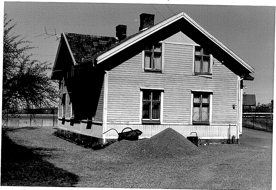
Bostadshus a fr.S, 13:14.