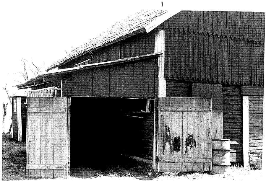
Uthus d fr.V, 13:18.