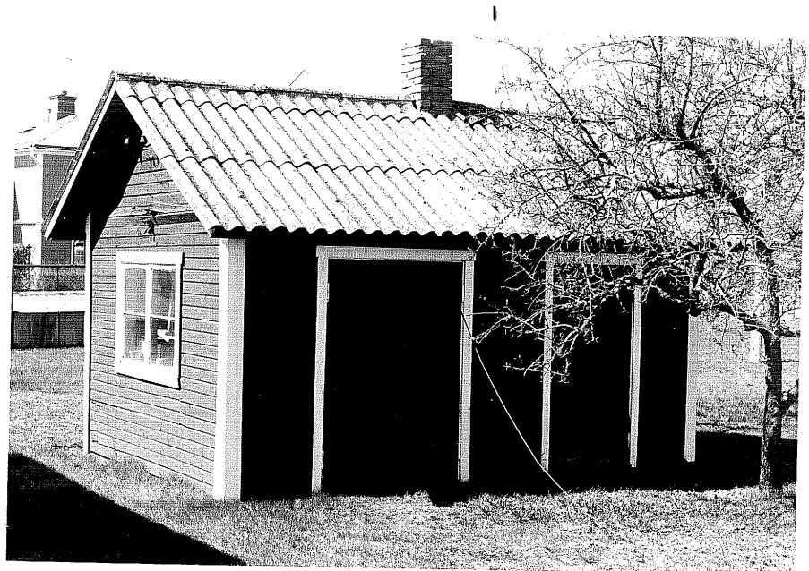
Uthus b fr.O, 13:17.