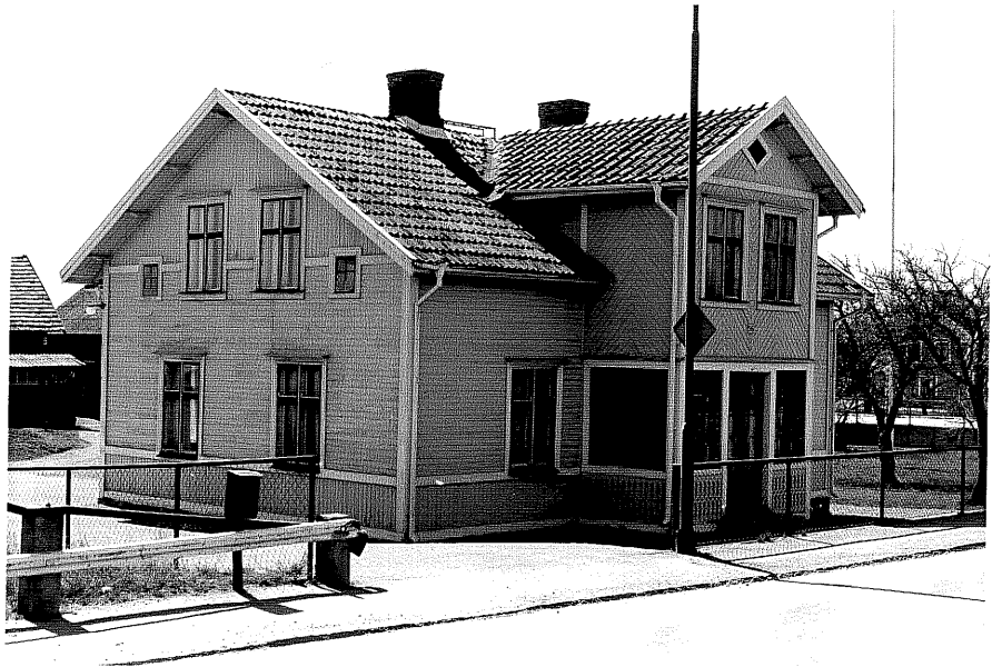
Bostadshus a fr.NO, 13:15.