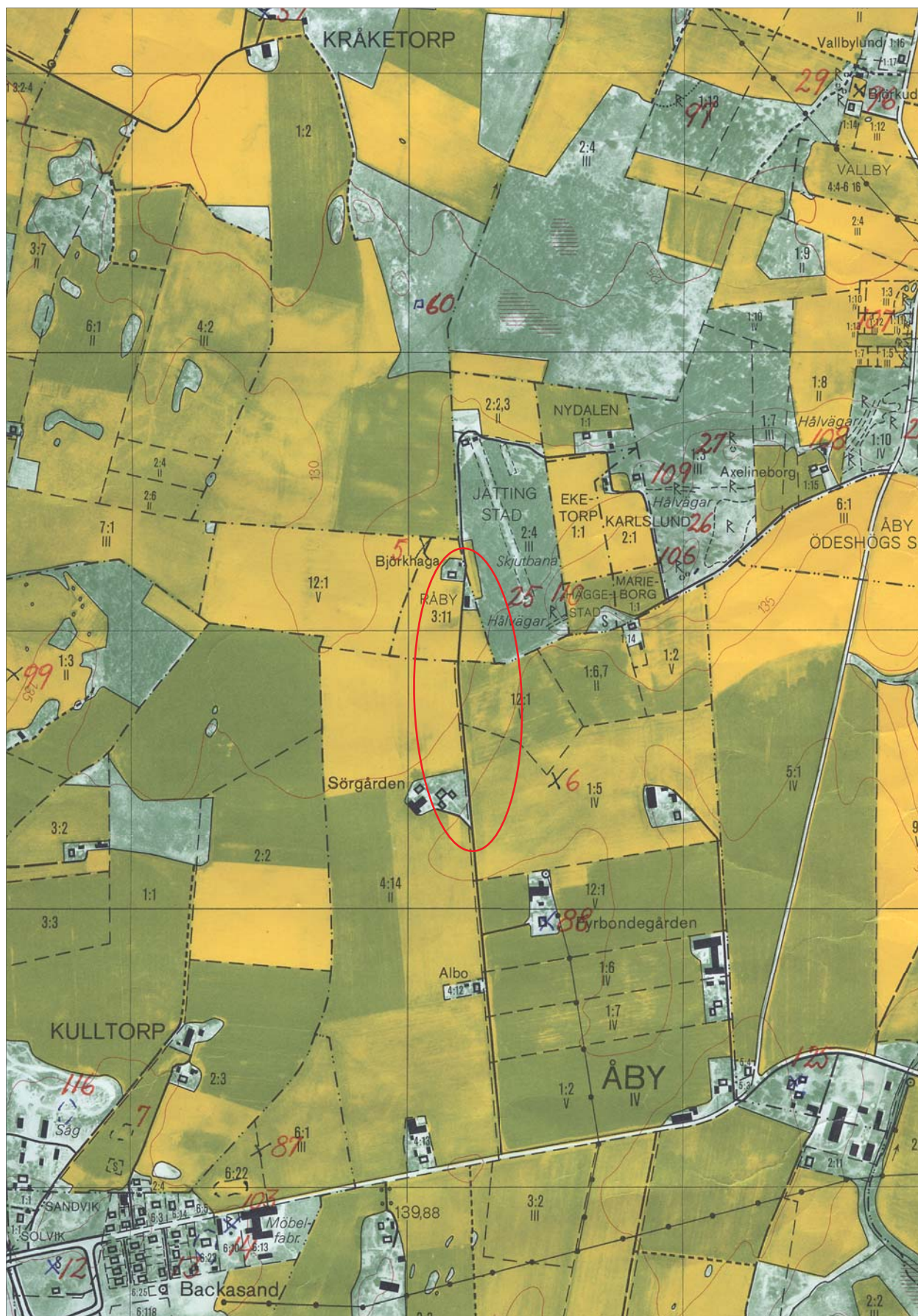
Figur 2. Utdrag ur Ekonomiska kartans blad 084 16 med undersökningsområdet markerat. Skala 1:10 000.