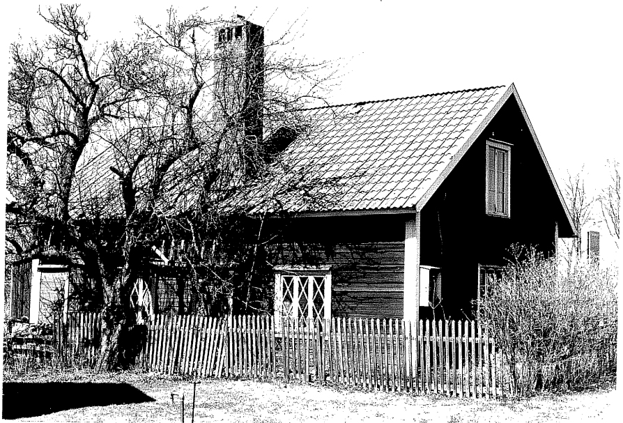
Smedja fr.S0, 13:9.