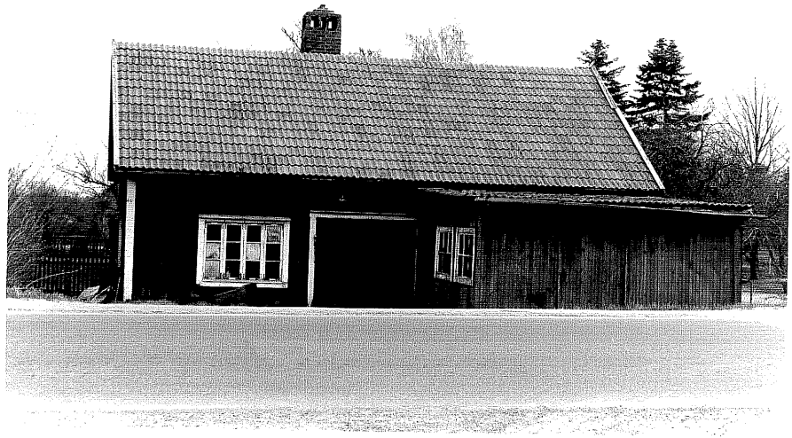
Smedja fr.N, 17:13.

Ödeshög sn Åby Jutegård 3 5 Mjölbyvägen 44. 1978.