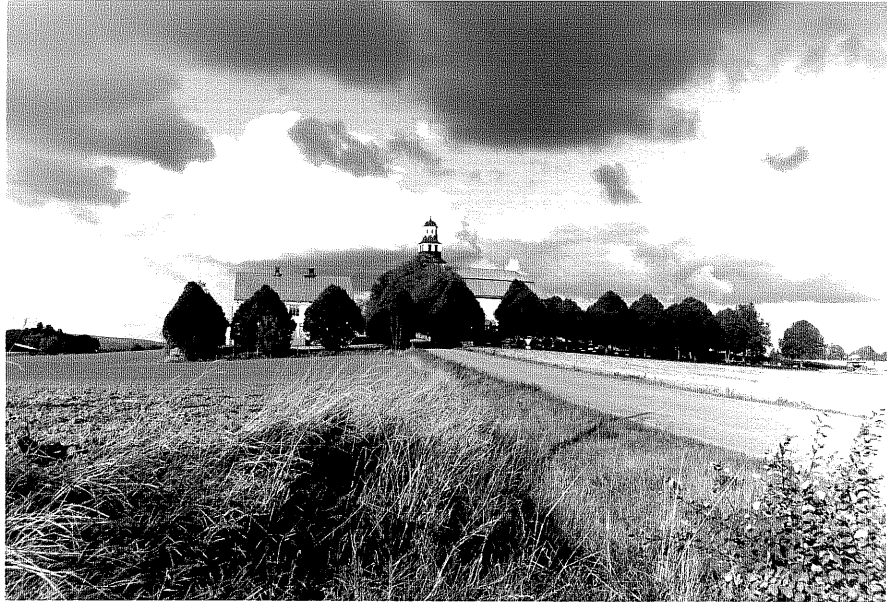
Neg.nr ÖKM 06:10 Miljö från S