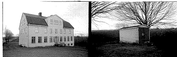
fd Skola från NO 31. Garage från NO 32.