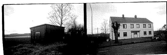
Redskapsbod från 33 fd lärarbostad 34 50 från 0