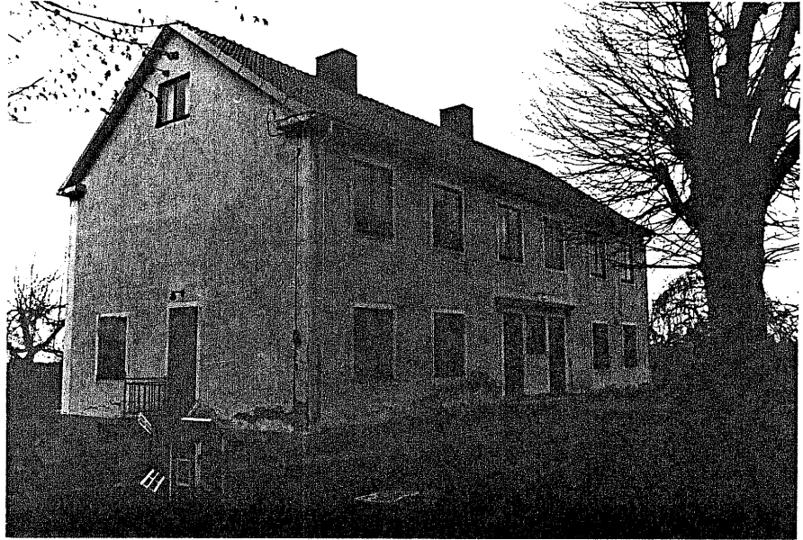
Neg nr 05:78:06 Lärbostad från SO.

St Åby socken Kyrkogården 1:1 St Åby skola