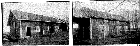
fd Magasin 7. från SV 13 Uthus 8 från SV 14