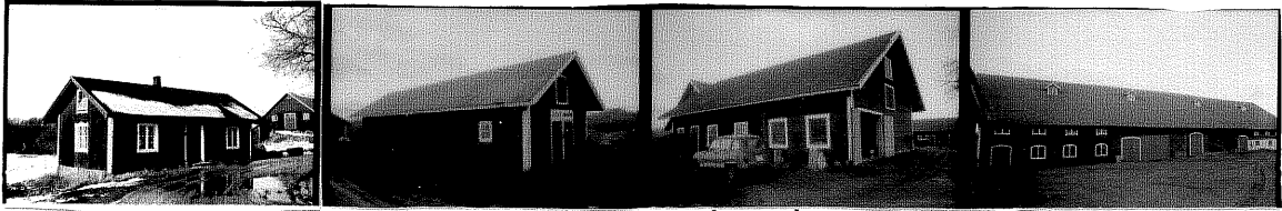
Uthus 3. från SO 13 Uthus 4 från NO 10 fd Magasin 5. från Ö 11 Ladugård från SO 12