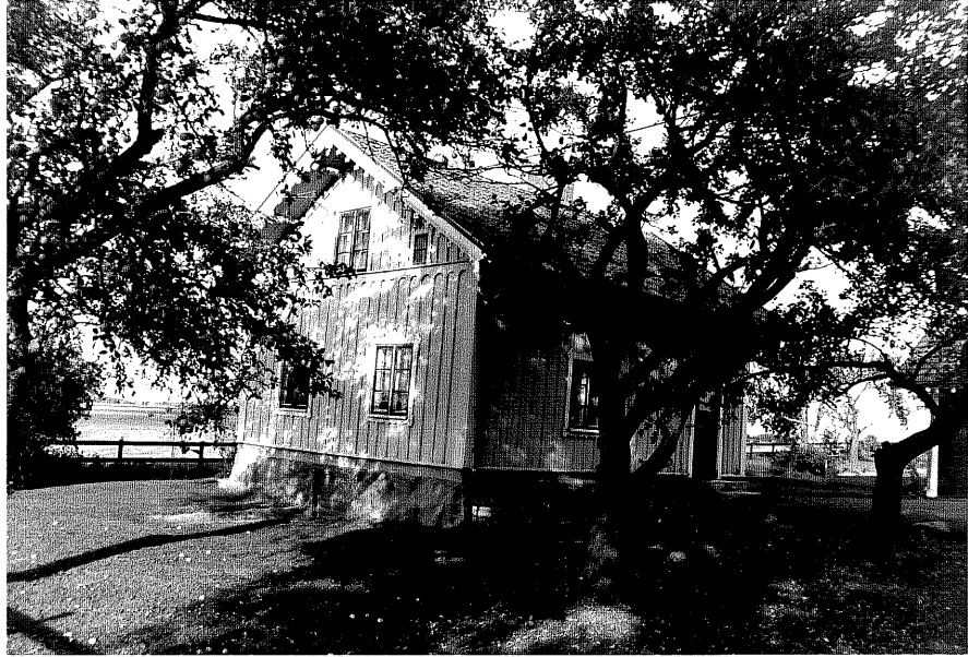
Neg.nr ÖKM 06:35 Bostadshus från SV Byggnad a

Ödeshögs kommun Stora Åby socken Stora Åby 1:5 Gärdeslätt