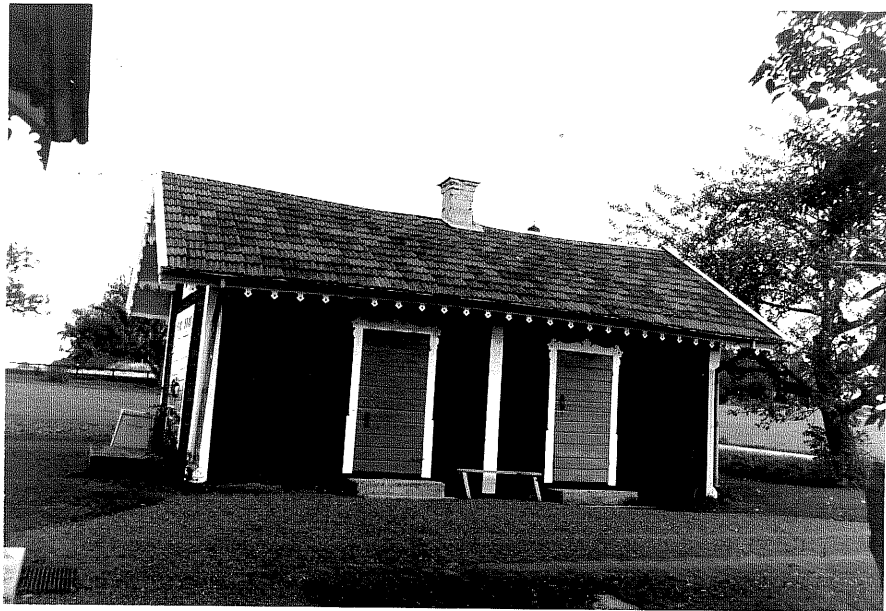
Neg.nr ÖKM 06:27 Uthus från V Byggnad b