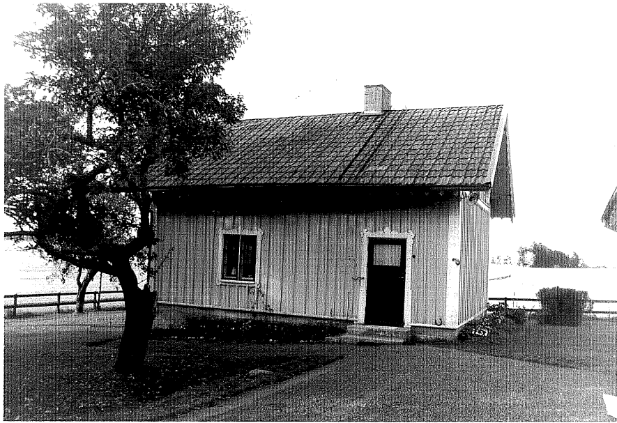
Neg.nr ÖKM 06:32 Bostadshus från S Byggnad a

Ödeshögs kommun Stora Åby socken Stora Åby 1:5 Gärdeslätt 1