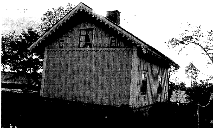
Neg.nr ÖKM 06:29 Bostadshus från NO Byggnad a