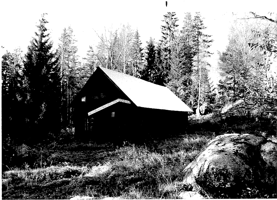
Neg. nr. T 05:05