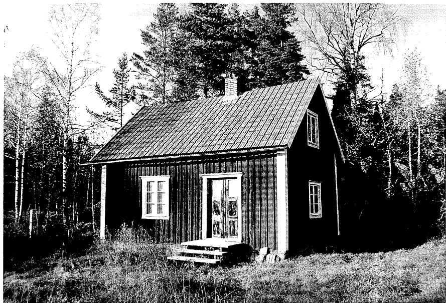
Neg. nr. T 05:08 Norra huset från SO