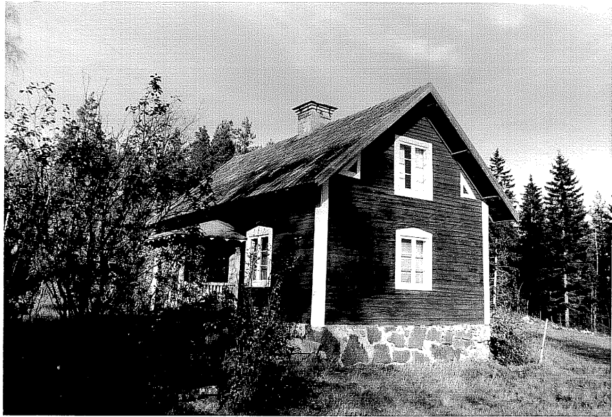
Neg. nr. T 05:07 Södra huset från S