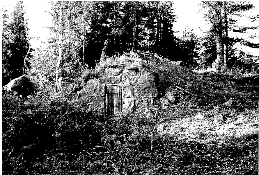
Neg. nr. T 05:10