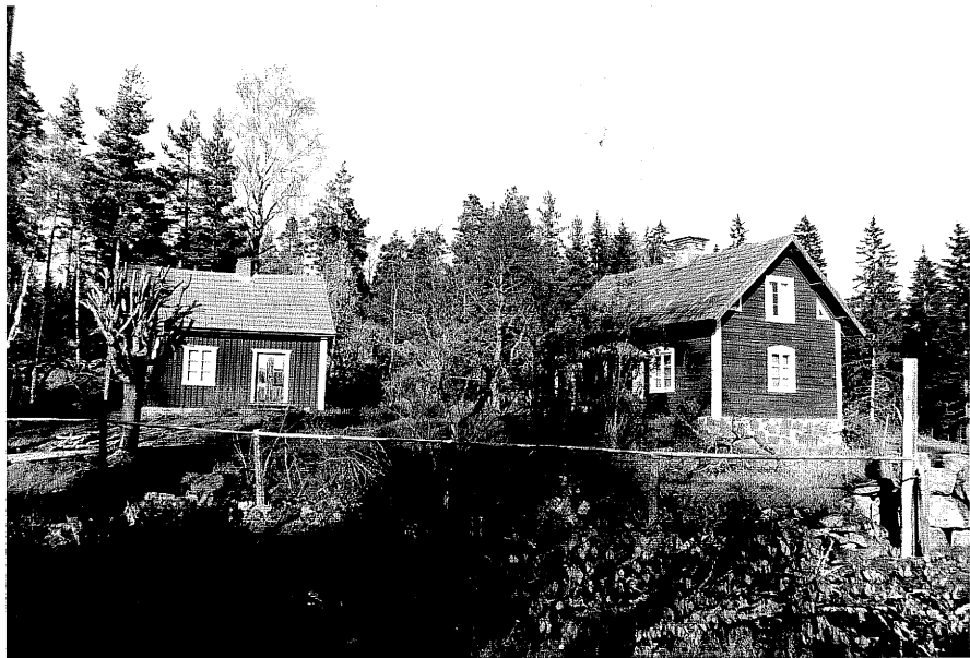
Neg. nr. T 05:03