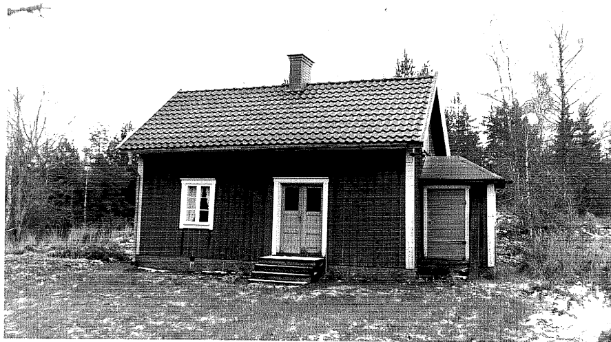
Neg. nr. T 11:10 Undantagsstuga från N