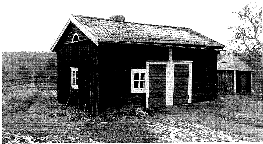
Neg. nr. T 11:13 Bod från S

Ödeshögs kommun Trehörna socken Ödebjörnarps 1:2 Skogäng