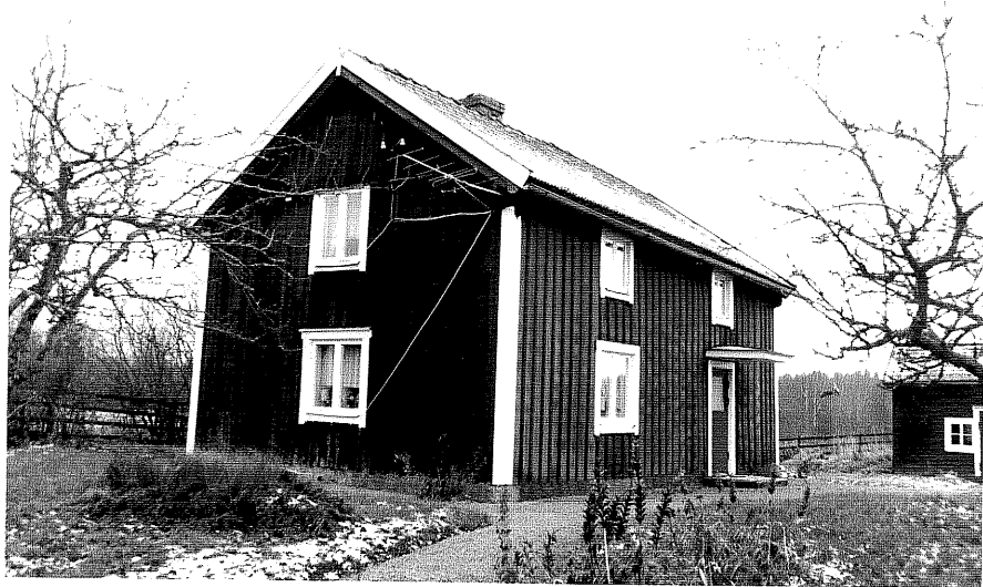
Neg. nr. T 11:09 Skogäng från NO

Ödeshögs kommun Trehörna socken Ödebjörnarps 1:2 Skogäng