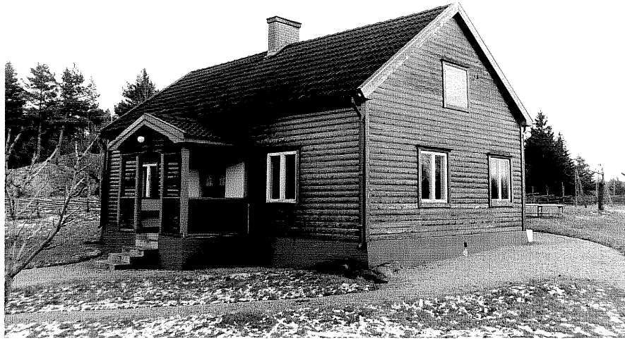
Neg. nr. T 11:02 Sörgården från NV

Ödeshögs kommun Trehörna socken Ödebjörnarp 1:5 Ödebjörnarp, Södergård