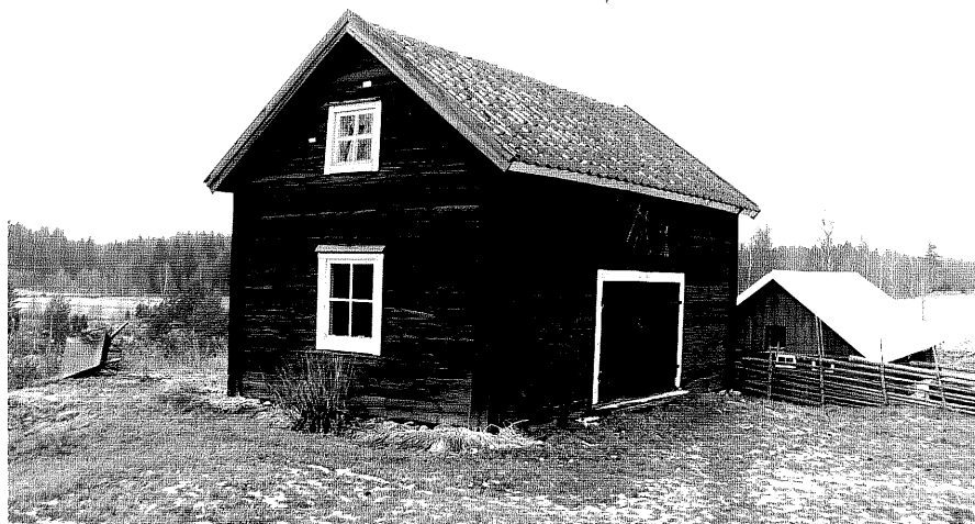
Neg. nr. T 11:03 Bod från SÖ