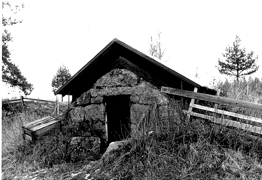
Neg. nr. T 11:04 Jordkällare från V

Ödeshögs kommun Trehörna socken Ödebjörnarps 1:5 Ödebjörnarps, Södergård