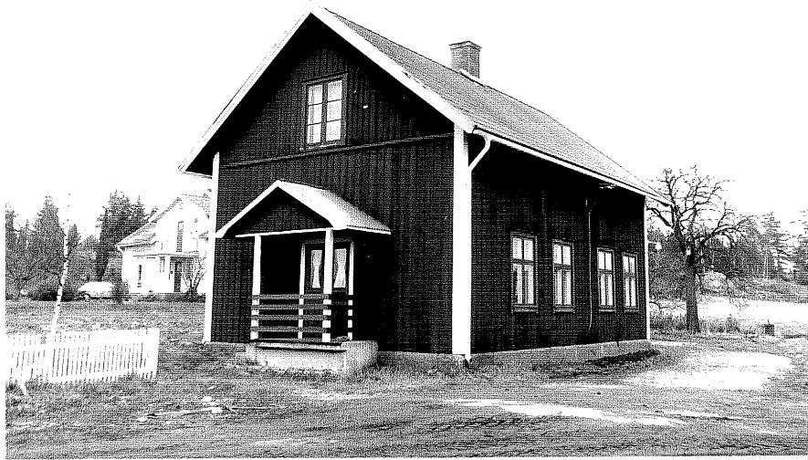
Neg. nr. T 11:01 Ödebjörnarps, arbetarbostad från V

Ödeshögs kommun Trehörna socken Ödebjörnarps 1:6 Ödebjörnarps, Norrgården