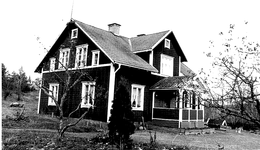
Neg. nr. T 11:05 Bostadshuset från SV

Ödeshögs kommun Trehörna socken Ödebjörnarp 1:8 Björneberg