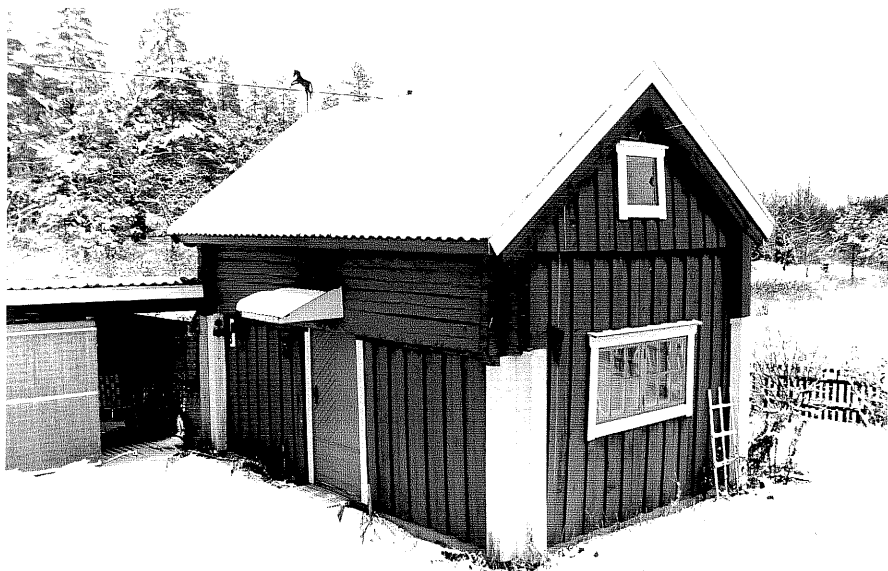
Neg. nr. T 12:21 Bod med utkraning från N