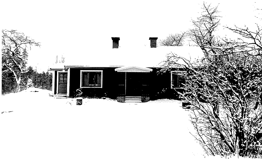
Neg. nr. T 12:20 Bostadshuset från O