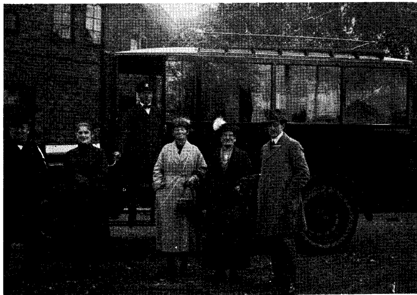
Grännabussen förr i världen.