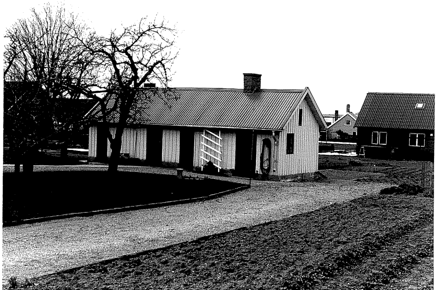
Uthus b fr.90, 15:16.