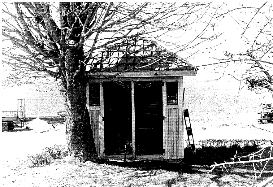
Avträde e fr.S, 13:30.