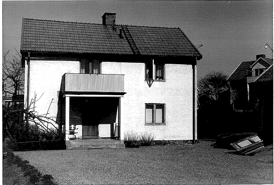
Bostadshus a fr,V, 13:28.

Ödeshög sn Ödeshög Gatugård 10 2 Vadstenavägen foto:M.Wikdahl,1978.