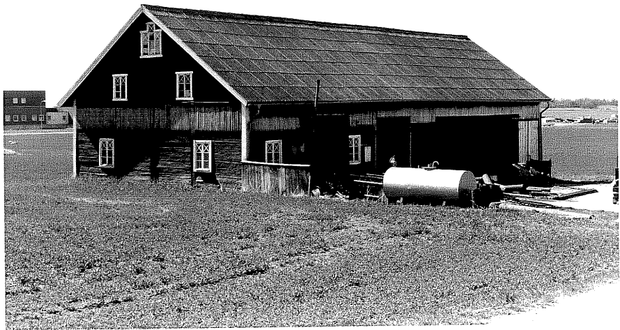
Ladugård d fr.50, 13:31.

Ödeshög sn Ödeshög Gatugård 10 2 Vadstenavägen foto:M.Wikdahl,1978.