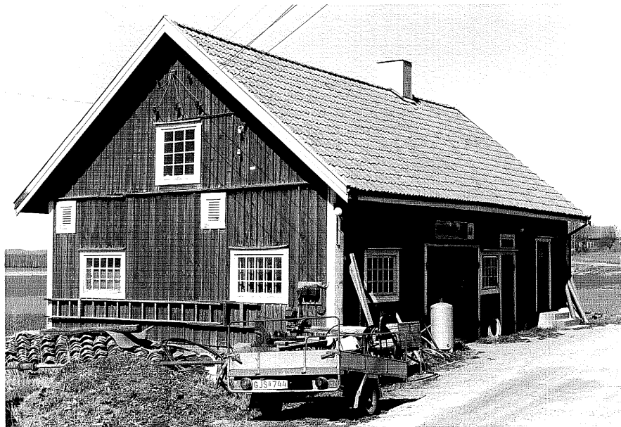
Uthus c fr.SV, 13:29.

Ödeshög sn Ödeshög Gatugård 10 2 Vadstenavägen foto:M.Wikdehl,1978.